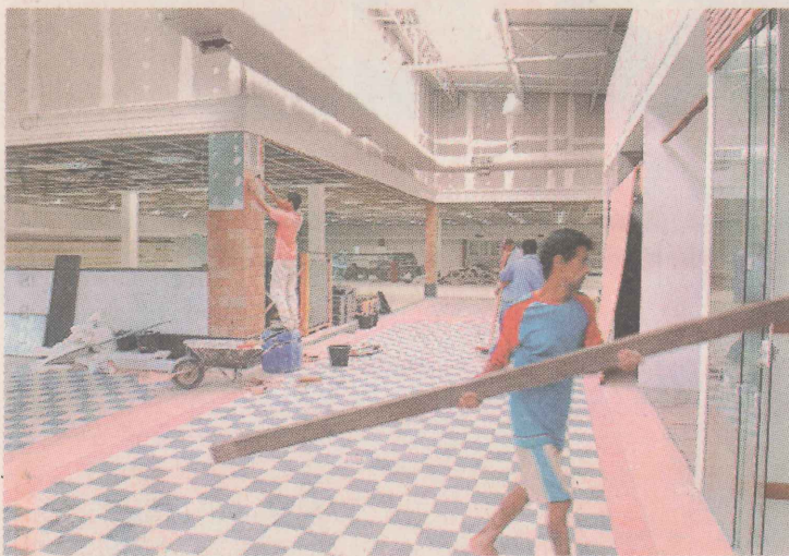
QUASE PRONTO. Homens fazem o acabamento final do Hortomercado, que tem 2.470 m 2 .