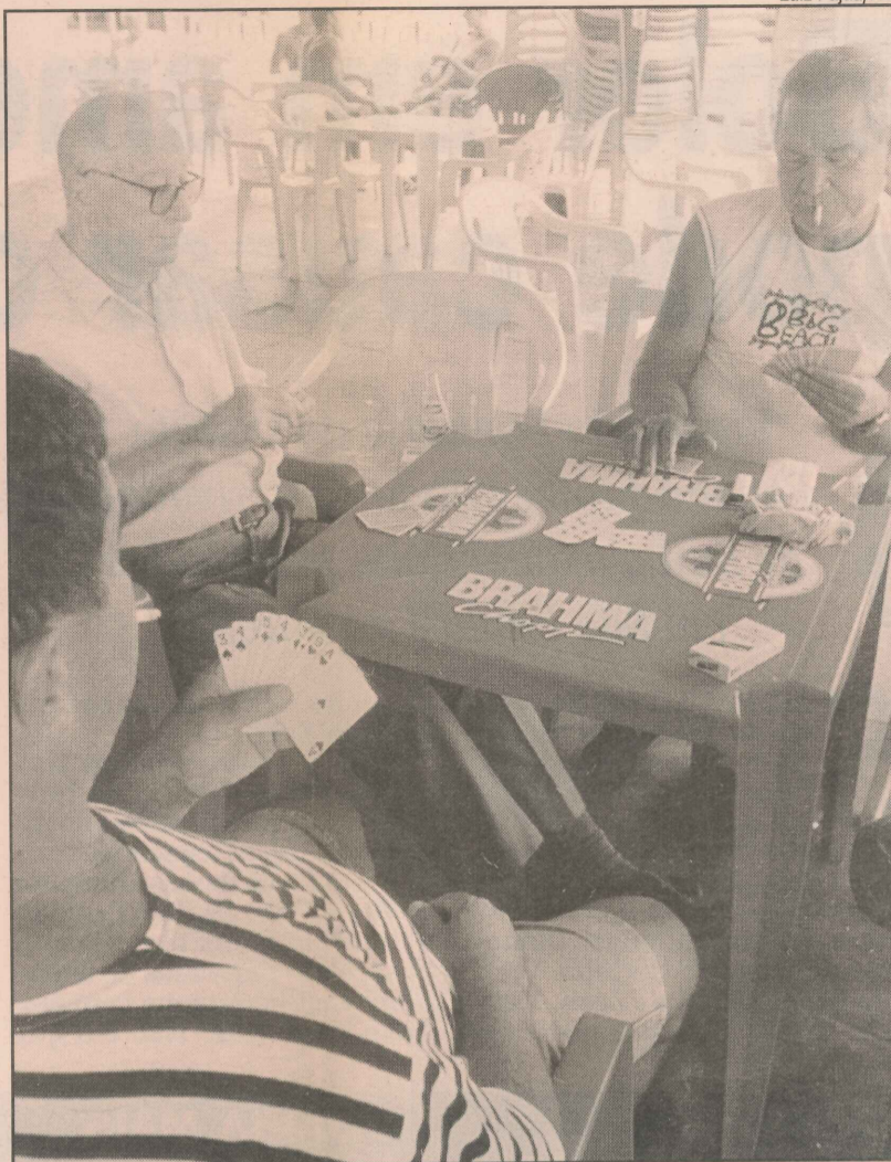
Aposentados se divertem jogando cartas nos barzinhos

"Temos queijo, calabresa, filé a palito, carne seca e caldos, mas se o cliente quiser pode comprar outro tipo de carne por fora e trazer que a gente faz. É muito comum também o pessoal comprar pescado nas peixarias aqui do bairro e pedir para a gente fazer a moqueca",