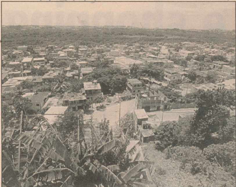
O bairro, na Grande São Pedro, possui mais de 1.400 residências