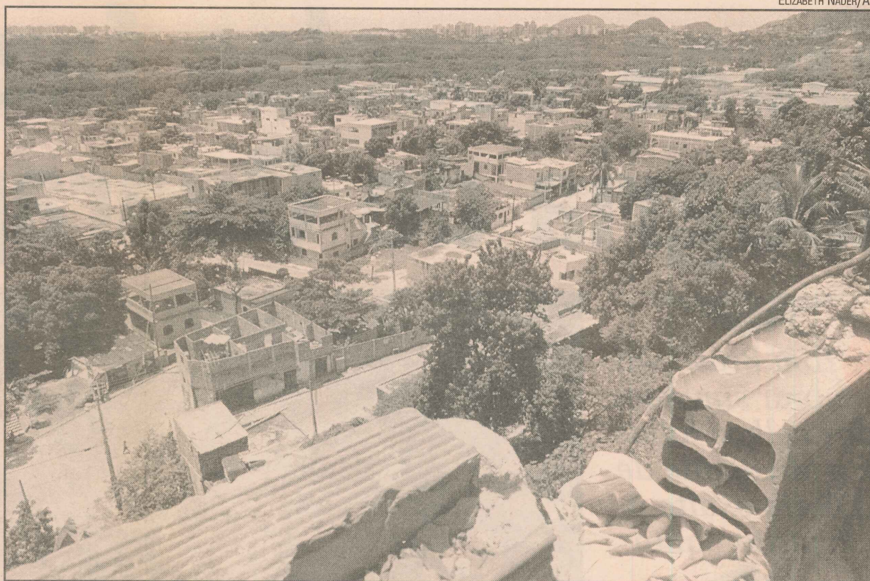
Resistência fica na Grande São Pedro, a apenas quatro quilômetros do centro da capital

Em relação à arrecadação, o Departamento de Receita da PMV informou que o valor do Imposto Predial e Territorial Urbano lançado no ano passado foi de R$ 75.225,32. O índice de inadimplência ficou em torno de 58,6%.