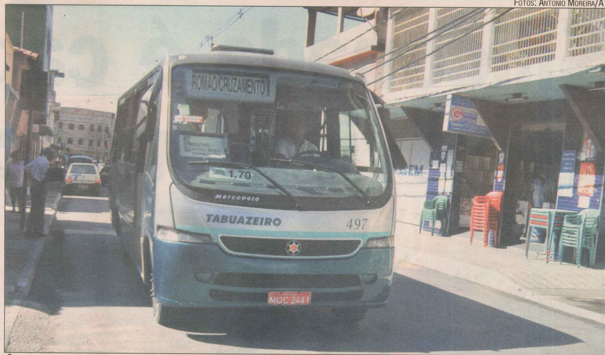
Ônibus da linha 105 circulando por rua do bairro Romão, em Vitória

Apesar de as ruas e escadarias da parte alta do Romão já terem nomes e códigos de endereçamento postal (CEP), os moradores não recebem correspondências, pois a numeração dos