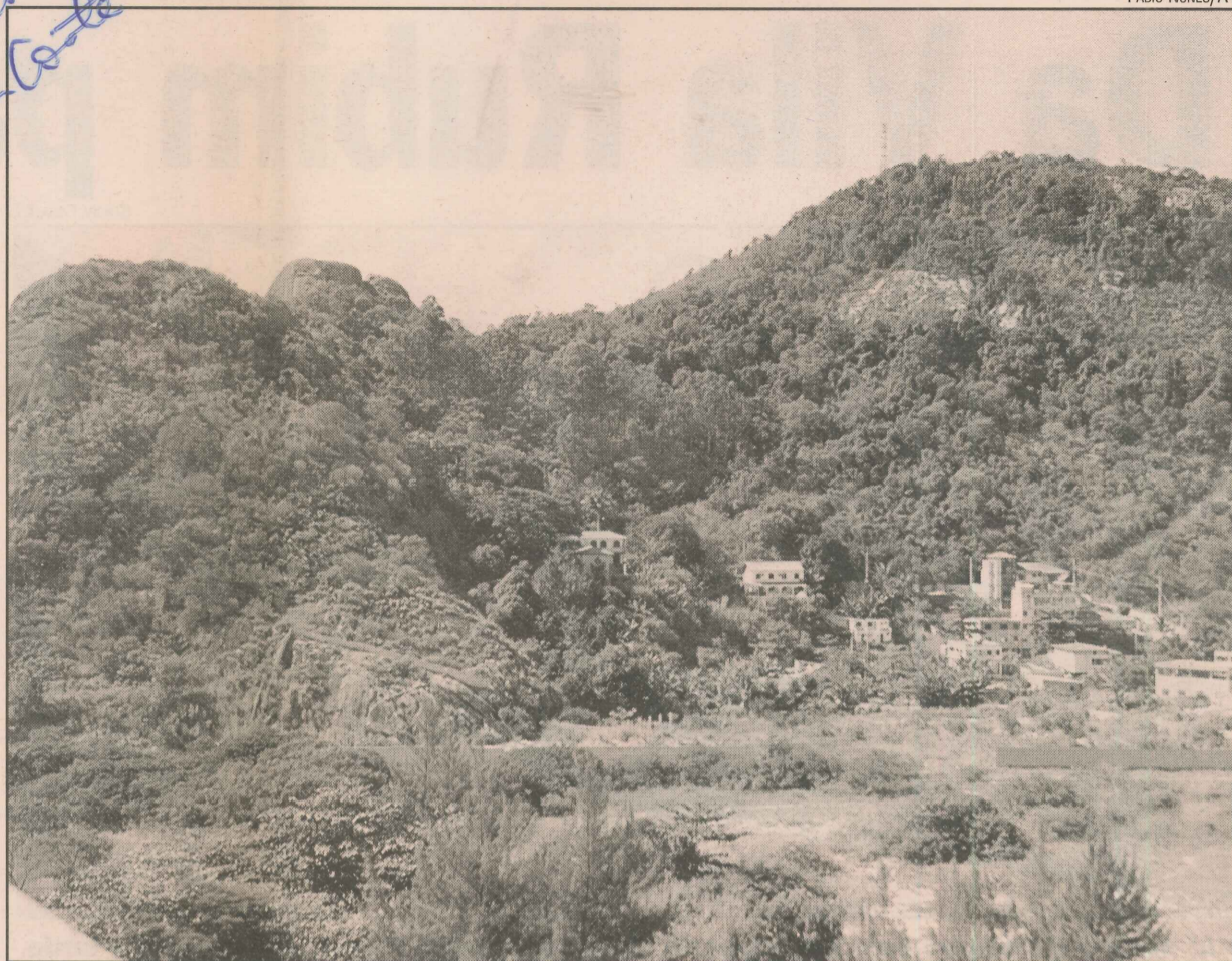
O Morro do Moreno possui 167 metros de altitude e virou "point" de esportistas

No calçadão ainda há a opção de passear de "carrocelas" - bicicletas de quatro rodas, com lugar para duas pessoas - que podem ser alugadas próximo à feirinha.