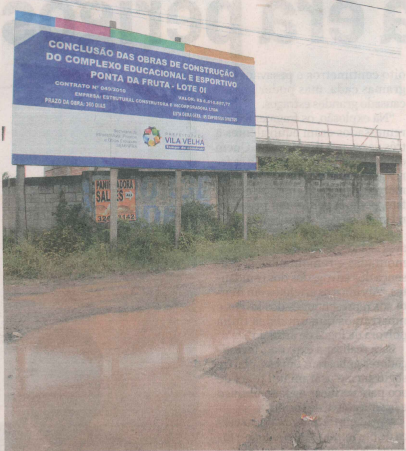
PLACA indica onde está sendo construída a nova escola de Ponta da Fruta