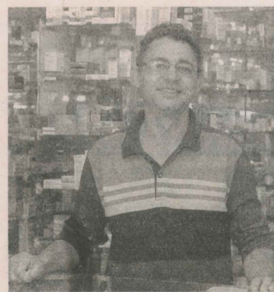
EDIMAR também mora no bairro

FONTES: IBGE E ASSOCIAÇÃO DE MORADORES DE RIO MARINHO