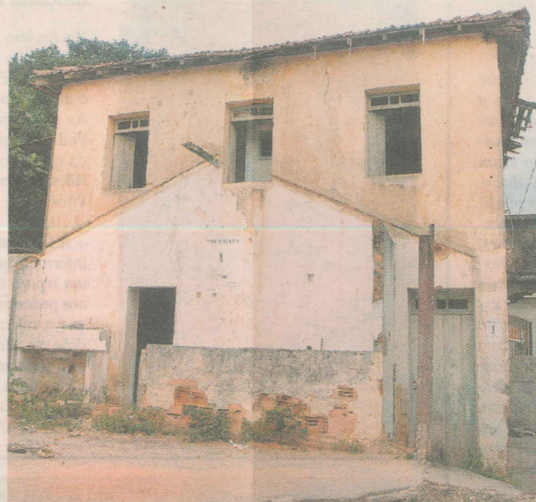
PROBLEMAS. Falta de asfalto em ruas e não-conclusão do Museu do Pescador são as duas principais reclamações dos moradores junto à Prefeitura de Vitória.