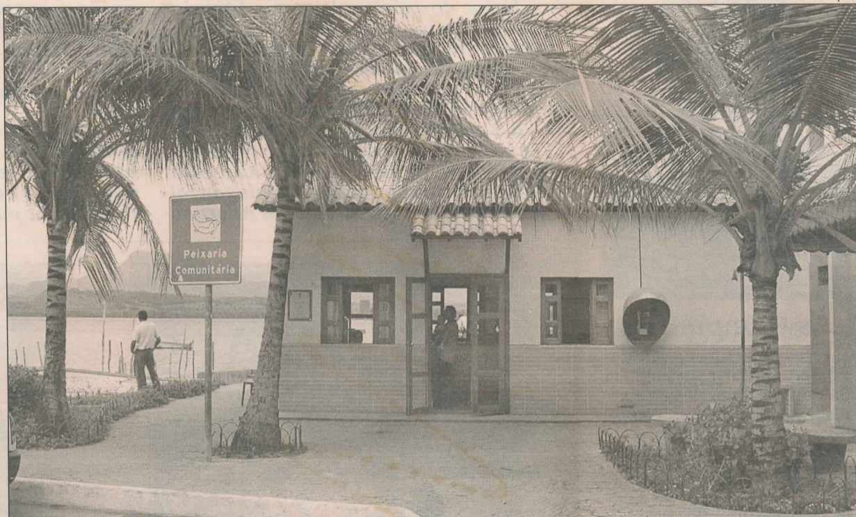
Ilha das Caieiras ganhou, há três semanas, uma peixaria comunitária

O bairro se destaca por estabelecimentos que oferecem pratos da tradicional culinária capixaba