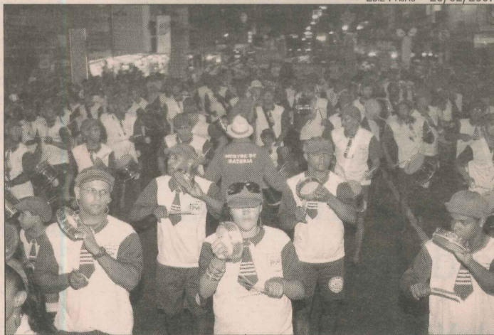
Desfile do bloco Amantes na Minha Piroga no Centro

"Os ensaios fazem parte da preparação do bloco para o Carnaval do ano que vem. Até o início de janeiro, eles acontecem às sextas-feiras. Depois, vamos ensaiar durante dois dias, provavel-