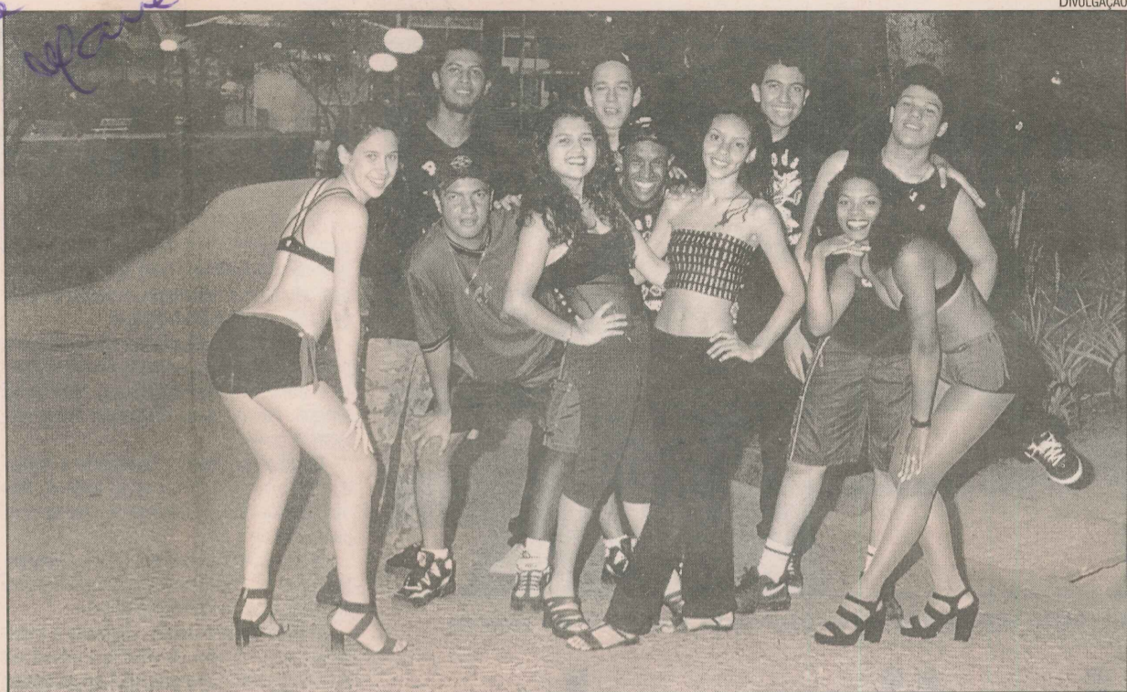
A banda Febre Humana, que surgiu em 1987, é composta por jovens do bairro

Os primeiros moradores chegaram à região na década de 20. O acesso da ilha à avenida Vitória era destinado apenas aos pedestres