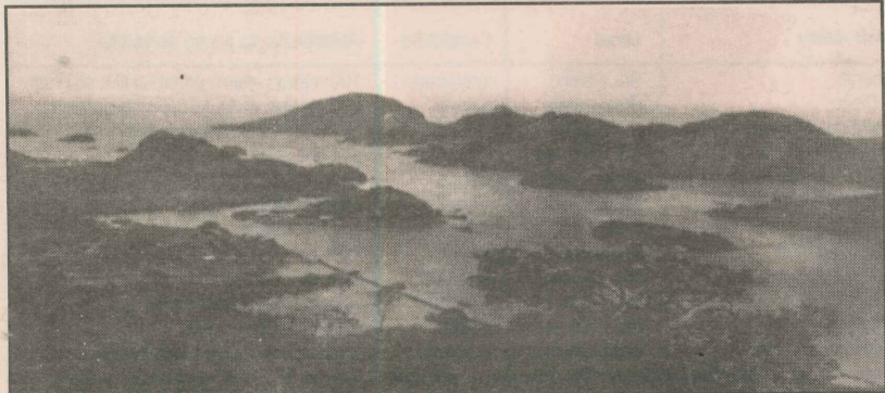
Vista da Ilha de Santa Maria e Monte Belo em 1937