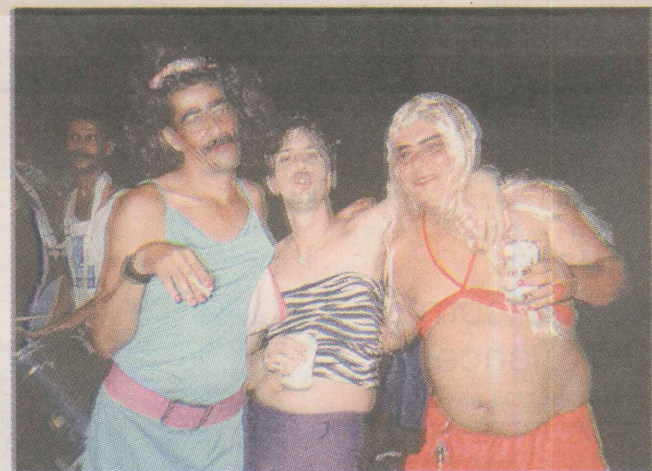
FOLIA. Os homens percorrem as ruas do bairro, vestidos de mulher para animar a comunidade.

Apesar de ser voltado para a Terceira Idade, pessoas com idade a partir de 18 anos podem participar. Basta comparecer ao salão de festas do condomínio Residencial Vila Park, nos dias de aula.