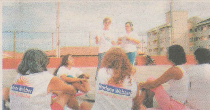
ATIVIDADES. As alunas têm aulas de alongamento, ginástica, artesanato, além de participarem de palestras.

Saber Viver. Esse é o nome do Grupo da Terceira Idade de Santa Inês, em Vila Velha, e é o que as vovós do bairro mais sabem fazer. Lição de vida é o que não faltam a elas, que chegaram a sofrer de depressão e redescobriram o sentido da vida.