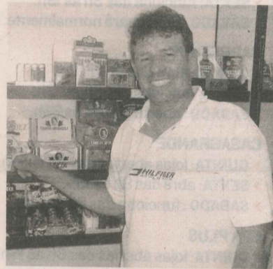
TADEU também vende importados

"Pensei em bar, restaurante e outros negócios, mas esse me pareceu mais rentável", afirmou.