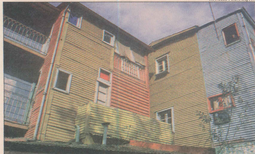
Caminito, em Buenos Aires, será usado como exemplo