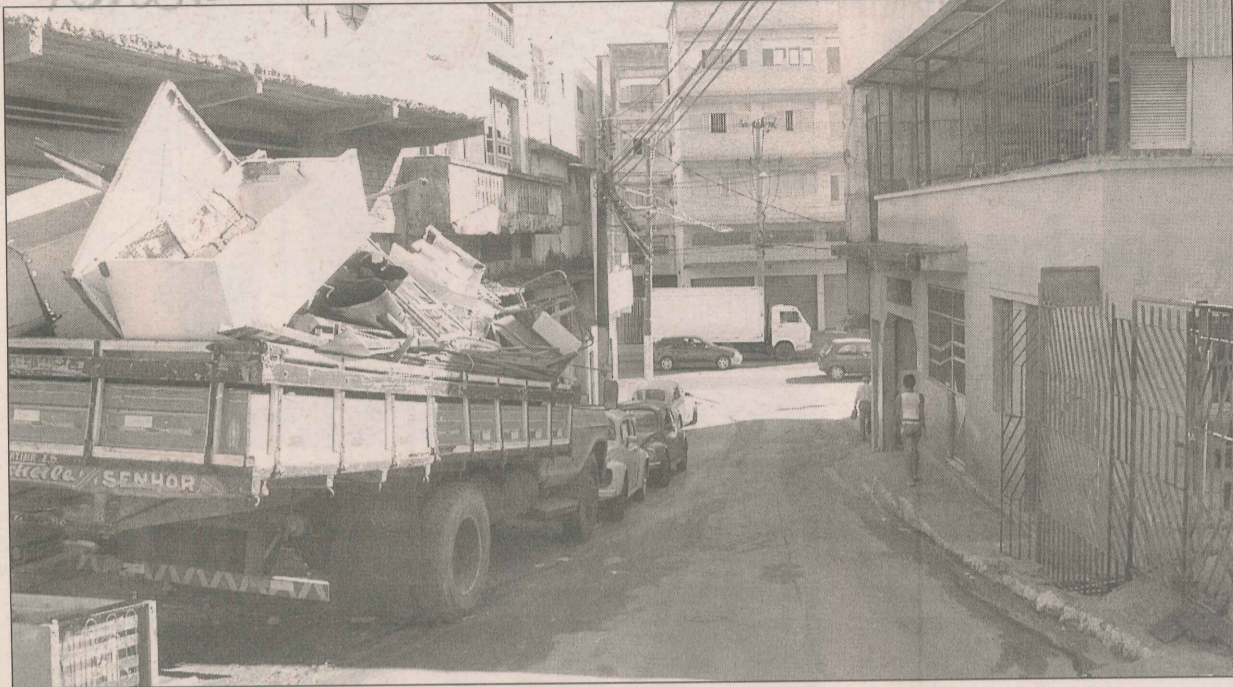
Rua Querubino Costa, onde moradores querem que tenha mão única

Moradores querem mão única em rua e guardas de trânsito para evitar acidentes