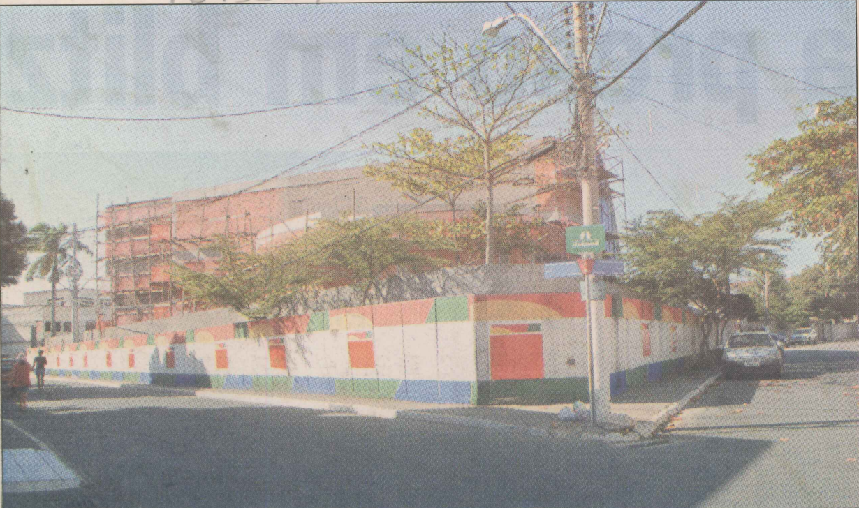
As obras da Escola Ceciliano Abel de Almeida ficam prontas até dezembro