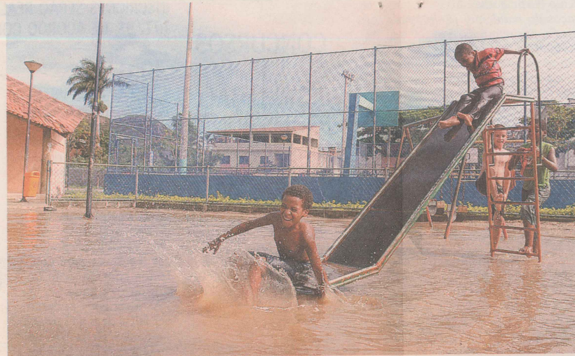
PROBLEMAS. Praça do bairro sofre com alagamentos e brinquedos quebrados.

TOME NOTA: Amanhã, veja quais são os orgulhos do bairro.