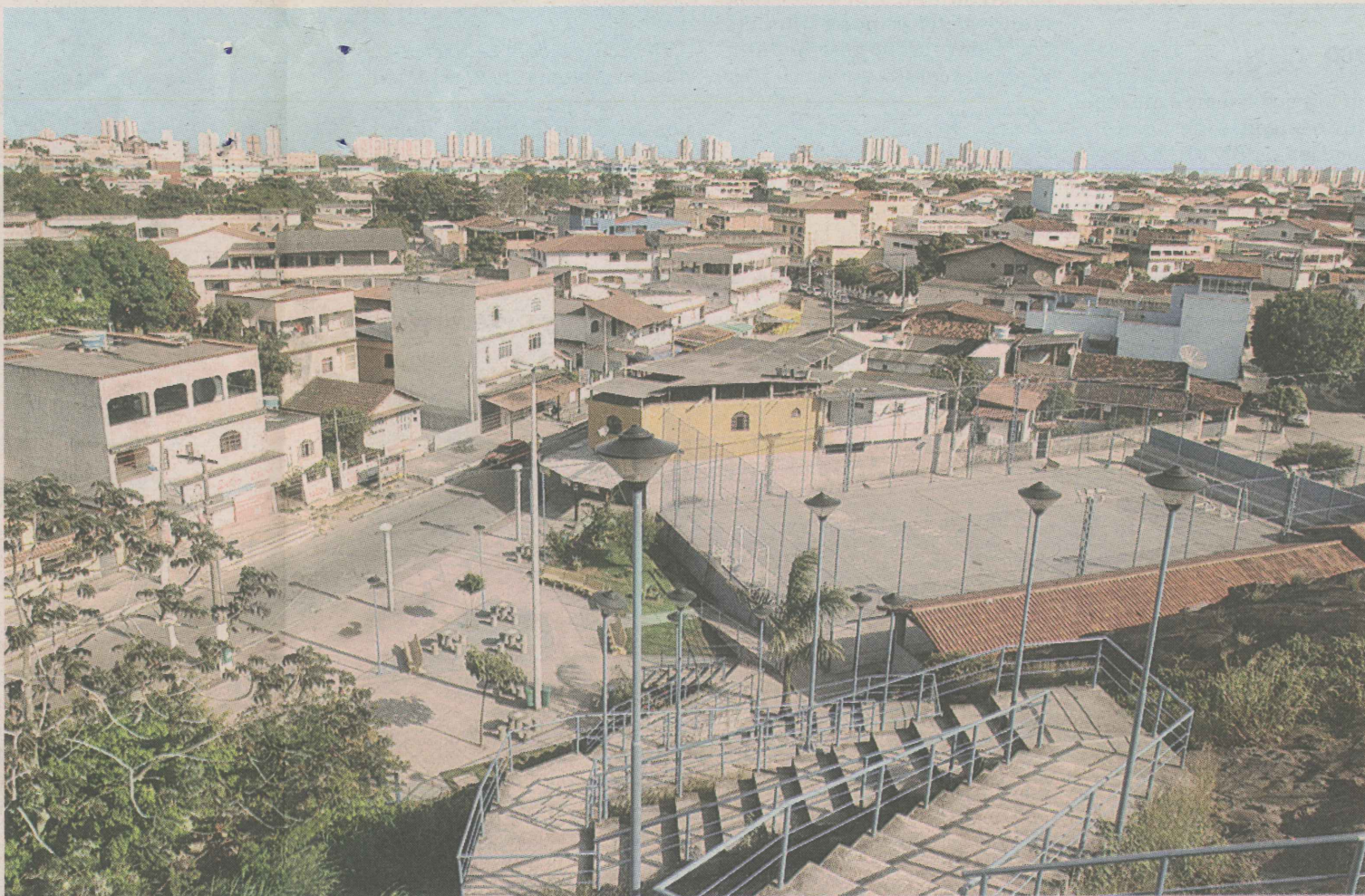
PERFIL Santos Dumont é um bairro tipicamente residencial, mas já conta com comércio suficiente para atender à demanda dos moradores, como supermercado e lojas de confecções