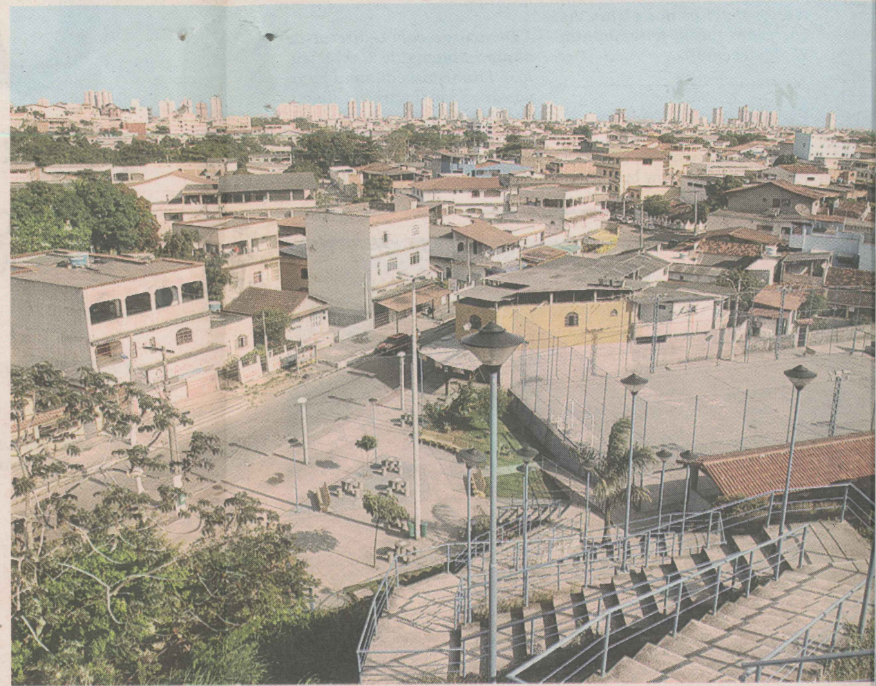
PERFIL. Santos Dumont é um bairro tipicamente residencial, mas já conta com comércio suficiente para atender à demanda dos moradores, como supermercado e lojas de confecções