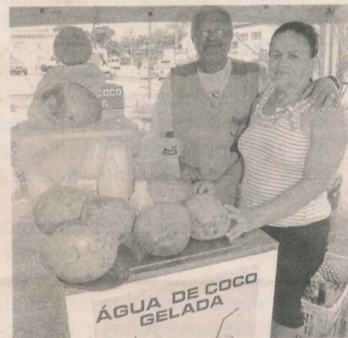
RECEPÇÃO a quem chega ao bairro

A água é 100% natural e os cocos vêm de São Gabriel da Palha, que fica no Norte do Estado.