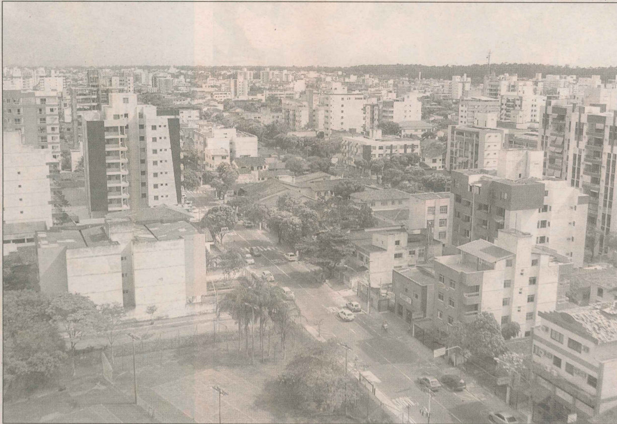
Vista de Jardim Camburi, que teve uma valorização de 50% nos imóveis depois de 2003