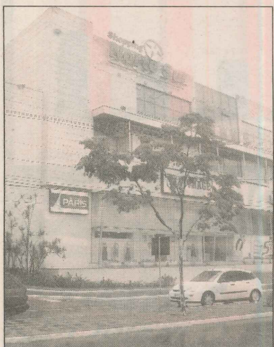
Shopping Norte Sul: incentivo

De acordo com o proprietário do estabelecimento, Marcelo Marques Vieira, cadernos e fichários serão vendidos a preço de custo. Na loja, que funciona há 13 anos no bairro, é possível encontrar grande variedade de materiais escolares, para escritório e suprimentos de informática.