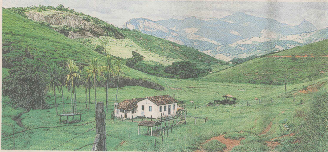
DIVERSÃO. Na região de serras do Estado, são comuns os passeios a sítios.

OS PREÇOS DOS PACOTES PARA O FERIADÃO DE 15 DE NOVEMBRO PARTEM DE R$ 359 E AS DIÁRIAS, DE R$ 20