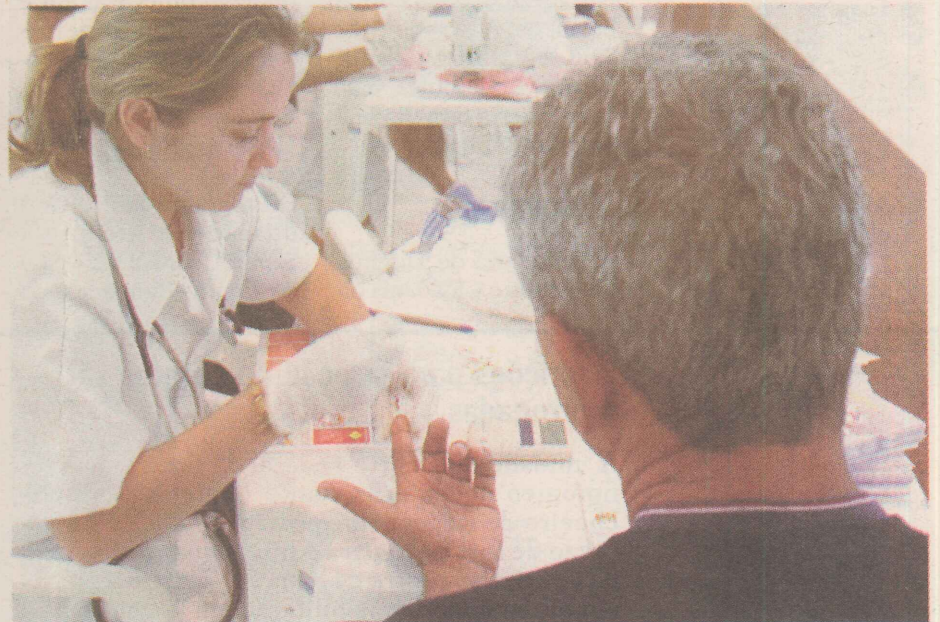
NÚMERO. Meta da Defensoria Pública do Estado é realizar 400 exames até o dia 31 de dezembro.

Quem já se inscreveu para verificação de paternidade e não foi chamado, deve comparecer com o filho ou filha e o suposto pai para ser atendido. Também para aqueles que ainda não se inscreveram, mas querem realizar o exame, a Defensoria está cadastrando novos pedidos.