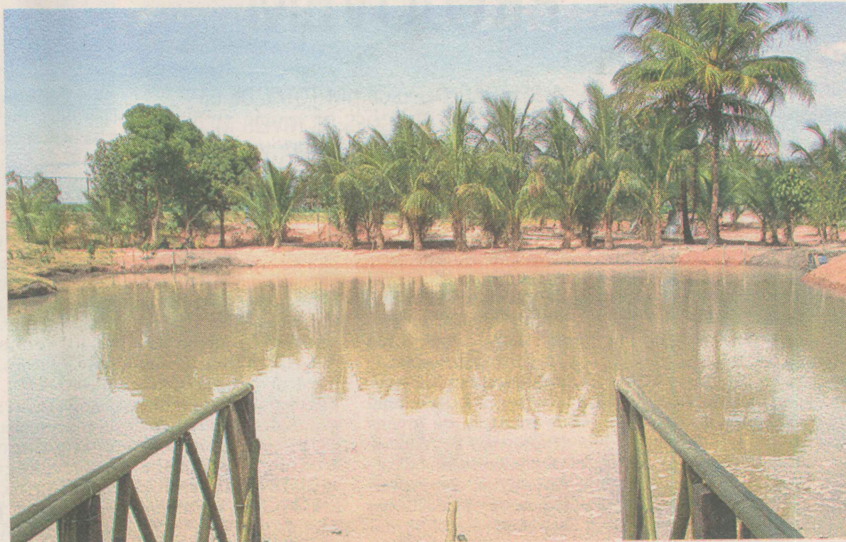
CENÁRIO. O córrego, cortado por uma ponte metálica, deságua em um grande lago, que serve de moradia para tartarugas e peixes.

O interior da fazendinha lembra um ambiente bucólico, caracterizado pelo