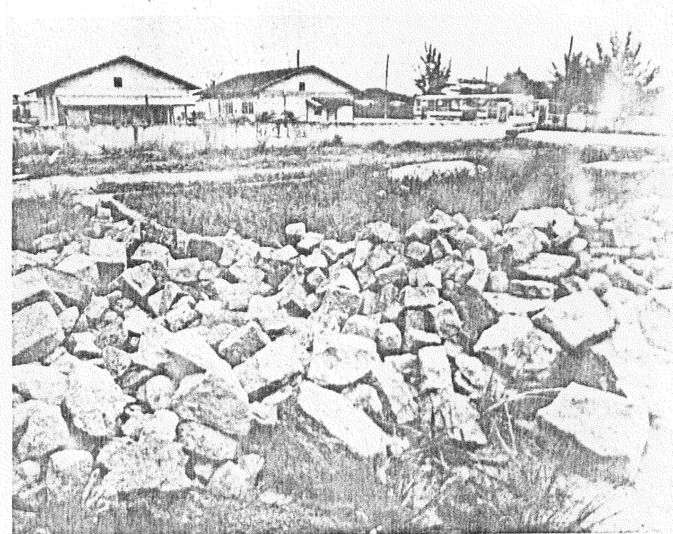
As ruas não estão calçadas. Mas existem as pedras