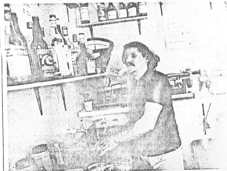
Os comerciantes reclamam dos assaltos