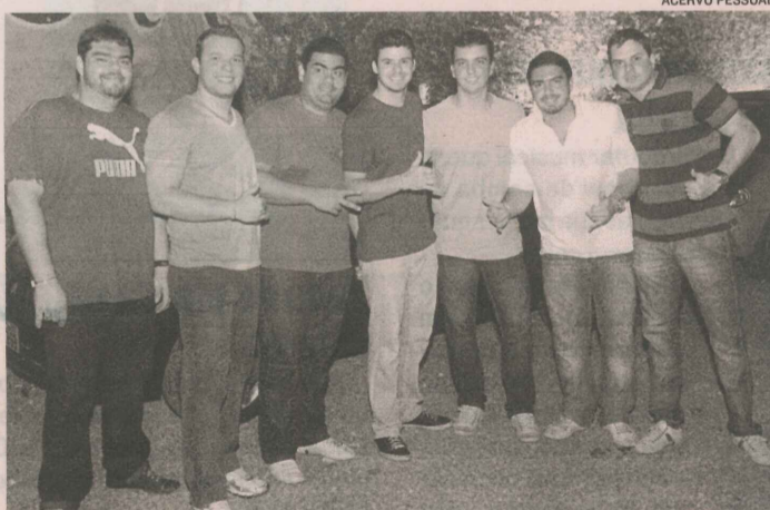
O GRUPO DU AVESSO começou a tocar em churrascos

O grupo é atração fixa no Turk Zoo aos domingos, às 18 horas. Em julho, os meninos vão gravar o primeiro CD com o sucesso deles: a música “Deixe estar”.