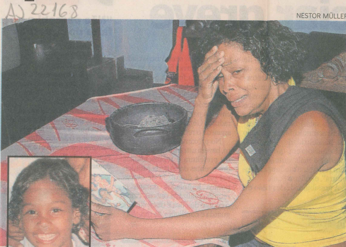
DOR. Mãe chora ao saber da morte da filha, que estava desaparecida

Antes de o corpo ser encontrado, o vigia de uma construção vizinha ouviu os gritos e choro de uma menina, vindos do local onde estava a vítima. Pouco depois, ele viu quando um rapaz moreno, vestindo