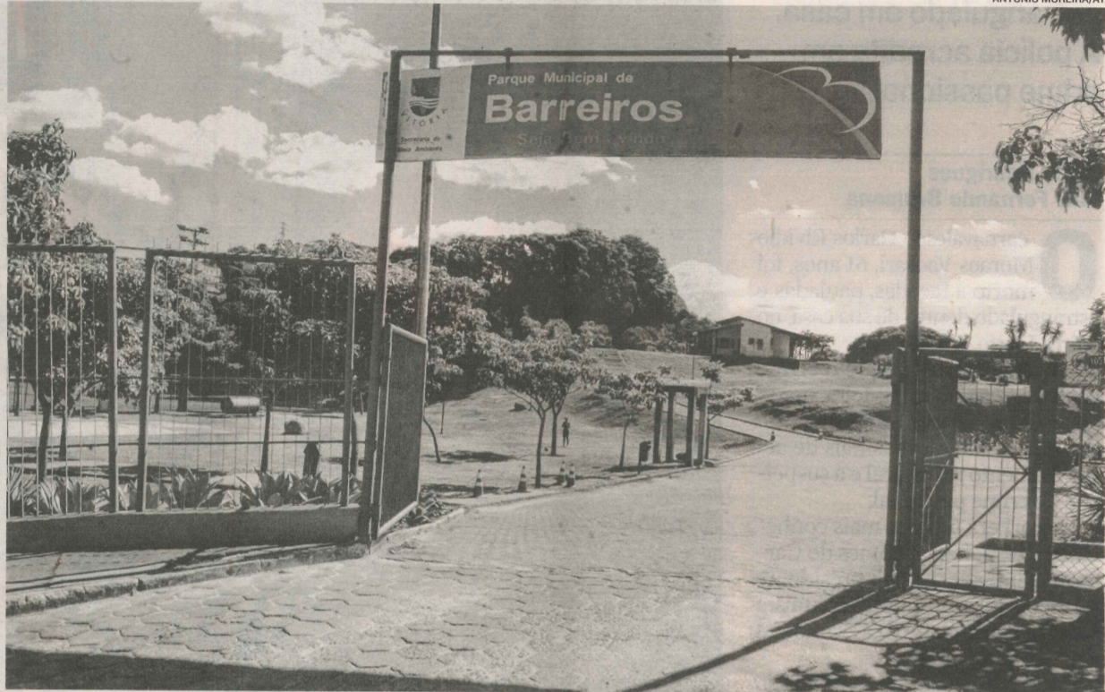
PARQUE MUNICIPAL DE BARREIROS é uma das áreas reivindicadas pela comunidade de Joana D'Arc, em Vitória

Em nota, a Secretaria de Desenvolvimento da Cidade (Sedec) in-