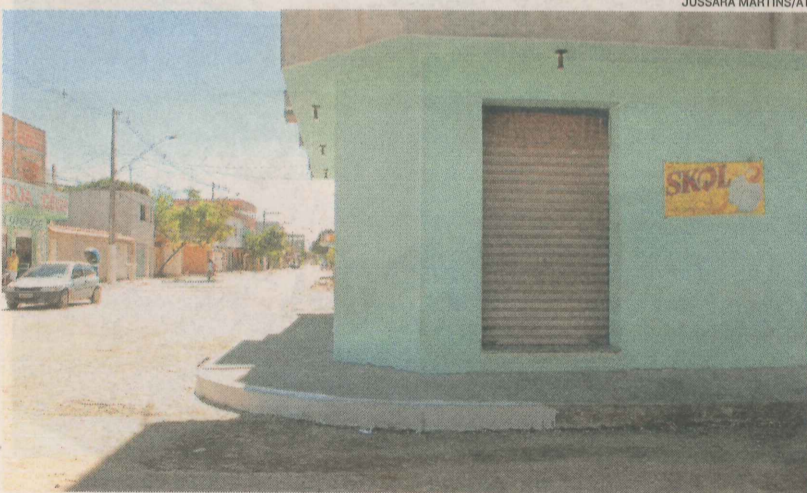
BAR NA BARRA DO JUCU onde comerciante foi baleado em assalto