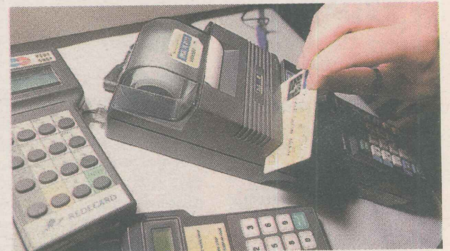
CONSUMISMO. Comprar por impulso é um dos sintomas do descontrole financeiro.

sumo, para identificar o problema. Se até hoje você nunca recusou um cartão de crédito, ou não perde uma liquidação, mesmo que não precise de nada que está sendo oferecido, coloque o pé no freio do consumo. Você vai se surpreender com o quanto conseguirá economizar cortando os gastos por impulso.