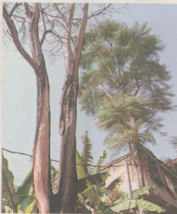
QUEDA. Os moradores temem que a queda delas causem tragédias. GABRIEL LORDÉLLO

Eles pedem providências com urgência para solucionar esse problema, já que, muitas famílias não têm recursos para pagar a passagem para seus filhos.