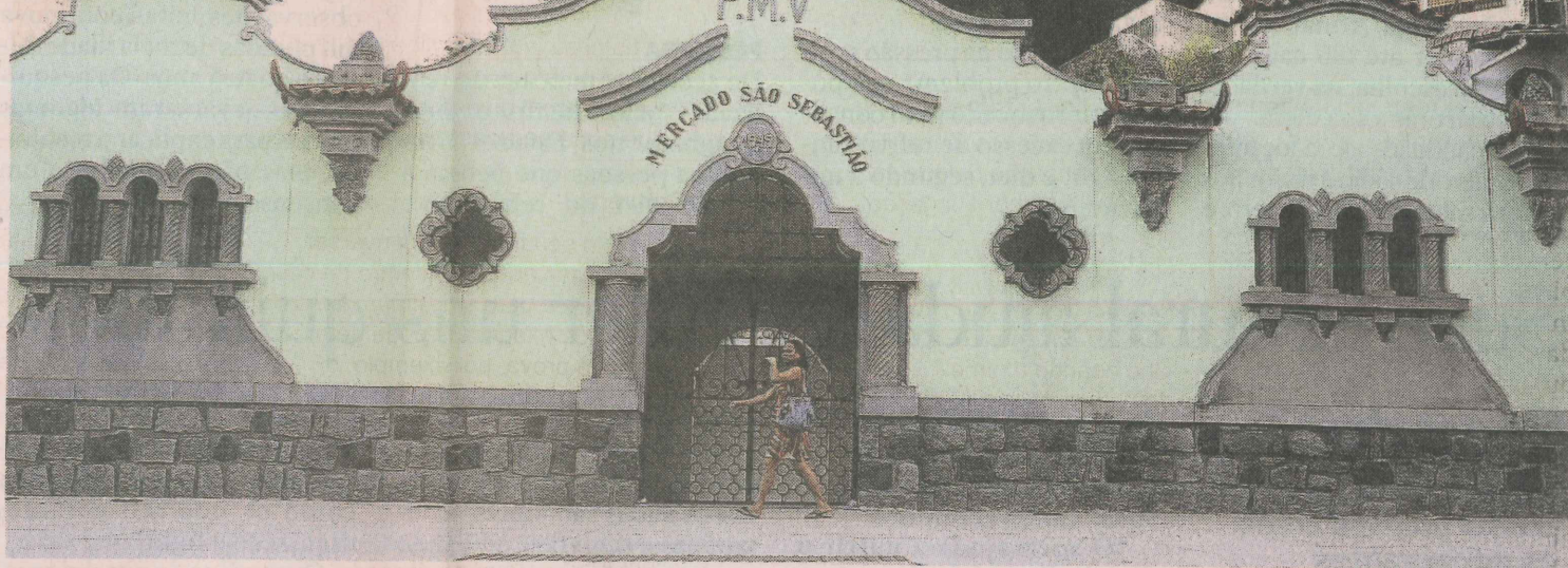
ESPAÇO OCIOSO. O Mercado São Sebastião, localizado na Avenida Paulino Müller, abriga eventos culturais esporadicamente

■ PROJETO: Existe um projeto da prefeitura para transformar o mercado em um centro de comercialização de artesanato e produtos da cultura capixaba, mas não há prazo para o início do funcionamento desse espaço. A Câmara de Vereadores ainda precisa aprovar uma lei para que se faça uma licitação a fim de escolher uma lanchonete para funcionar no local