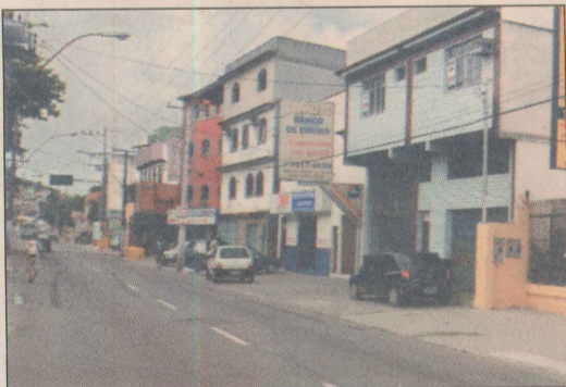
Rua Dona Maria Rosa: comércio