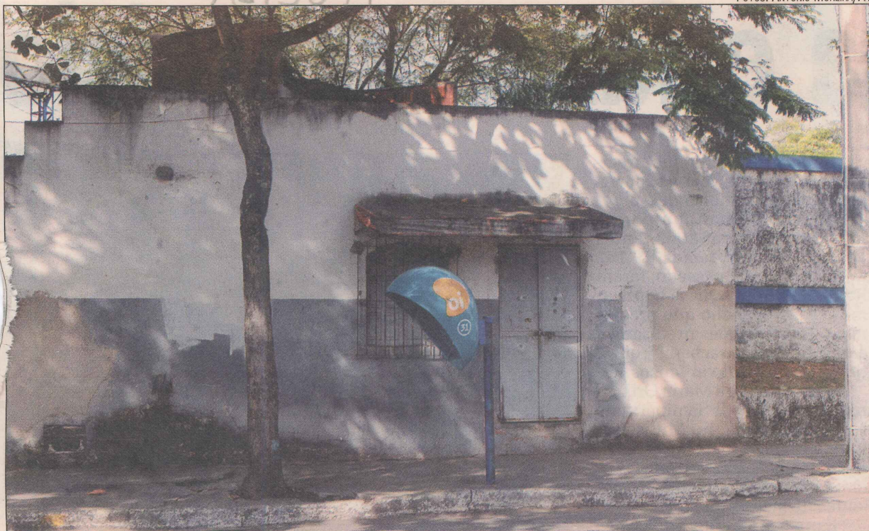
Destacamento da Polícia Militar (PM) que foi desativado no Bairro República