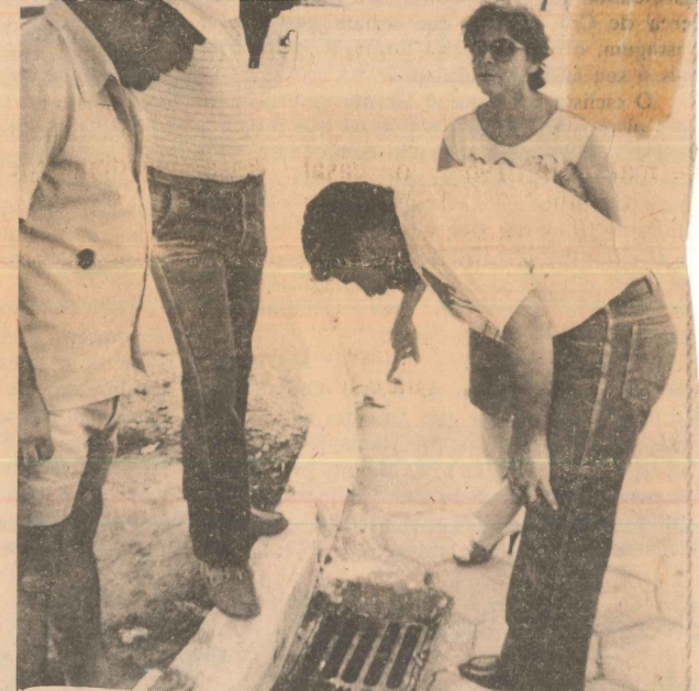
Os bueiros não resolvem os problemas