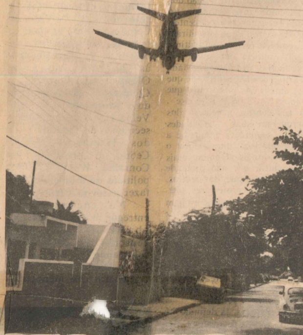
Os moradores só reclamam de pequenos incômodos

Bem arborizado, dotado de toda a infraestrutura urbana e de serviços, sem problemas de iluminação pública, transporte ou água potável, os moradores do Bairro República quase não têm motivos para reclamações. Construído em 1967, pela Cohab, o local não teve área reservada para lazer da população e esta é uma das principais reivindicações, associada a providências necessárias para disciplinar o movimento do trânsito de veículos em alguns pontos críticos, bem como para acabar com os alagamentos frequentes em épocas de chuvas que atormentam a vida dos moradores da rua Nove. O prefeito Berredo de Menezes, os secretários de Obras e de Serviços Urbanos, respectivamente, Humberto Vello e Ornóbio Camata, além do vereador Paulo Lindoso, estiveram no bairro e prometeram melhorias. Berredo garantiu que os problemas de alagamentos estarão resolvidos com a conclusão da galeria pluvial, à margem da avenida Adalberto Simão Nader. E um centro de lazer quatro vezes maior que o Parque Moscoso está cogitado para as proximidades do bairro, atendendo os pedidos neste sentido.