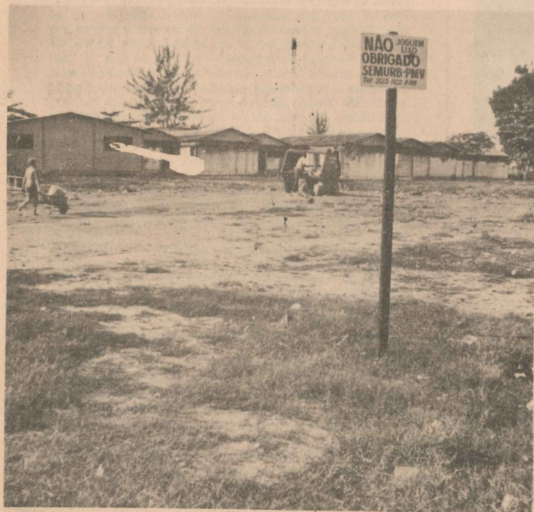
Aqui vai surgir um campo de futebol