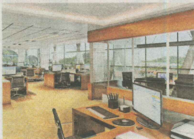
PROJEÇÃO de escritório

de obras, engenheiro civil e técnico de edificações.