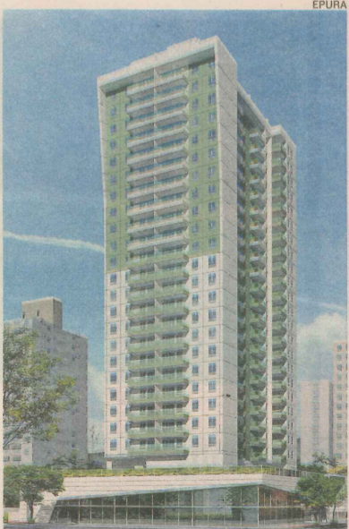
FACHADA do Sunset Residence