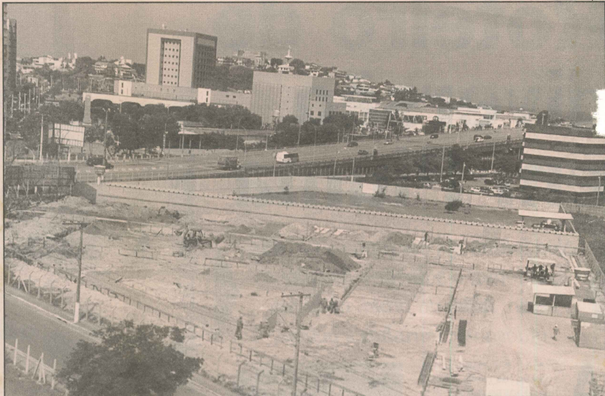
Obras do multiplace, que terá restaurantes, área para shows e estacionamento com 456 vagas

Ele ressaltou que os proprietários do negócio serão convocados para uma reunião na próxima semana, para retomar a discussão sobre a obra. A intenção é evitar que o multiplace cause impacto na região e debater o número de vagas disponíveis para estacionamento.