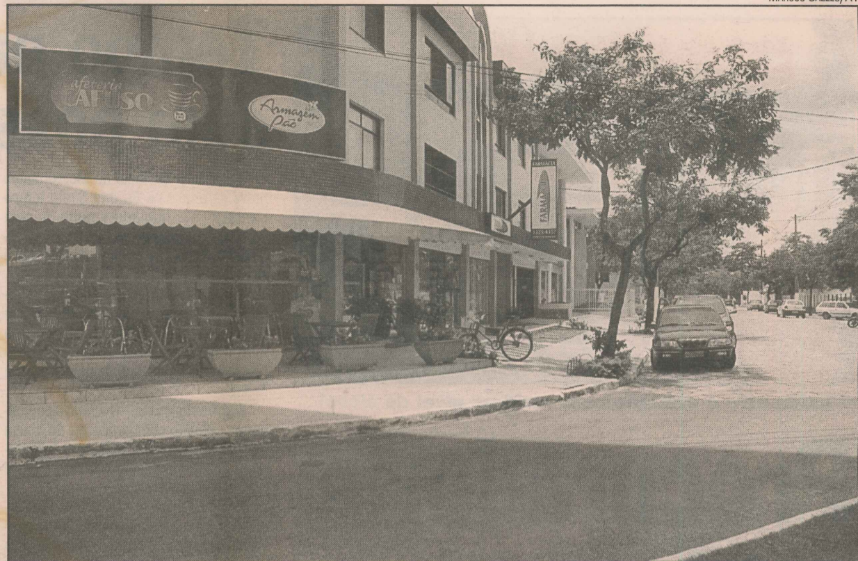
Padaria pioneira na região e que atende moradores da Enseada do Suá e da Ilha do Boi