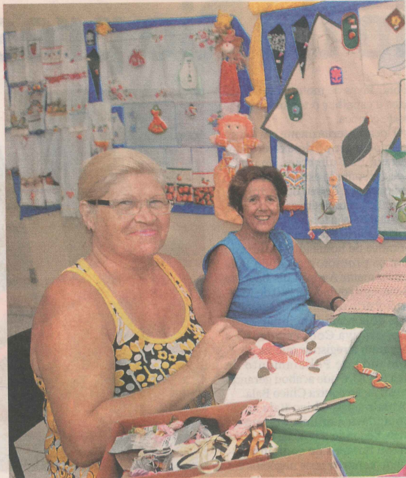
MORADORAS DE MARUÍPE desenvolvem habilidades artísticas nas aulas

Às quintas-feiras, das 14 às 17 horas, é a vez de professoras voluntárias, moradoras do bairro, com-