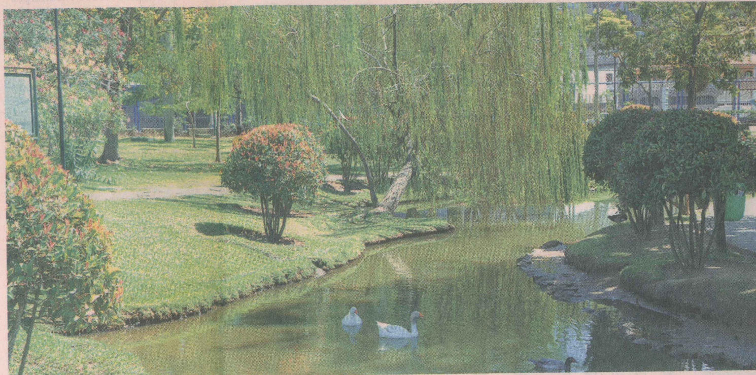
VERDE. Parque tem diversidade de espécies vegetais onde podem ser desenvolvidas atividades escolares

A prefeitura procurou recriar uma área verde com grande diversificação de espécies vegetais, principalmente, da Mata Atlântica, onde podem ser desenvolvidas atividades educativas, culturais e de lazer, com a população.