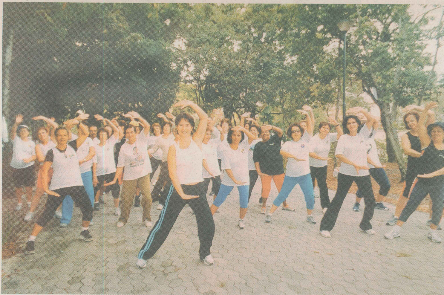
AULAS. Cerca de 50 alunos participam das aulas. As inscrições podem ser feitas no Parque Alfonso Pastore, nos dias das aulas. GABRIEL

■ Centro de Controle de Zoonoses. 3382-6753.