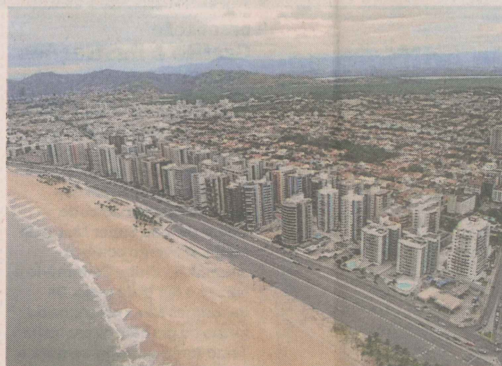
2010. Desenvolvido, o bairro mantém a parte unifamiliar