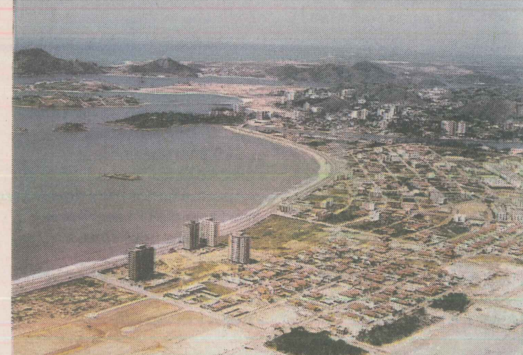
1980. A vegetação é preservada na Mata da Praia