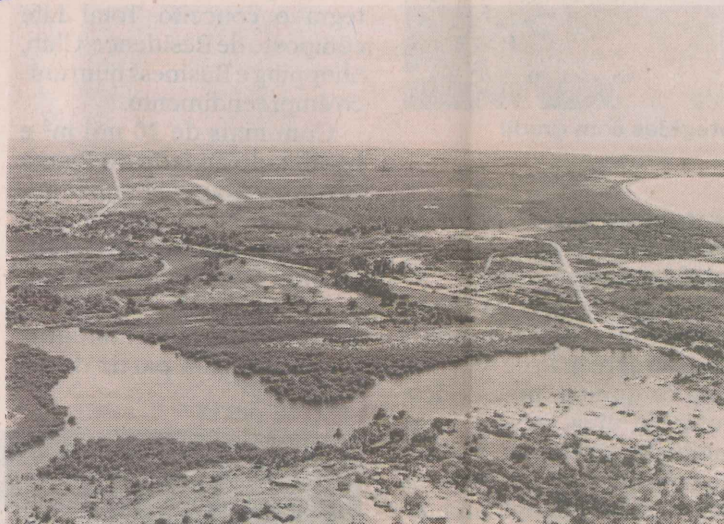
1960. Nessa década existia apenas a restinga

O bairro, projetado antes do primeiro plano diretor de Vitória, tem uma densidade populacional definida para áreas próximas à orla de Camburi: as superquadras (áreas dos prédios) podem ter no máximo 13 pavimentos e ocupar 30% do terreno reservado para o empreendi-