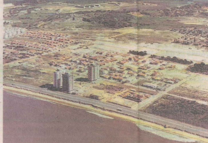
1978. As superquadras começam a ser construídas

Apaixonado pelo bairro, ele acredita que será preservada a qualidade de vida dos moradores somente se for respeitada a legislação original do bairro.