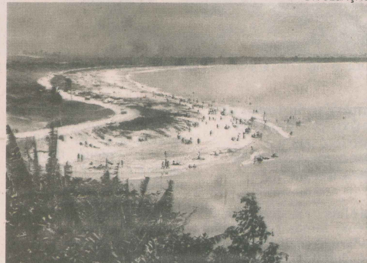
1969. Na Praia de Camburi, banhistas de outros bairros