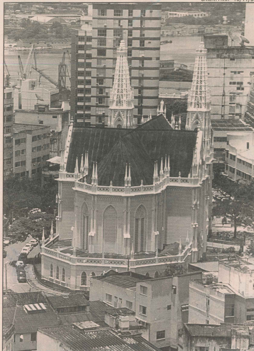
Catedral Metropolitana: beleza no coração da cidade

Por causa do desenho geográfico do Centro – entre a baía e morros – e o crescimento do número da frota, as vias acumulam problemas no fluxo de veículos.