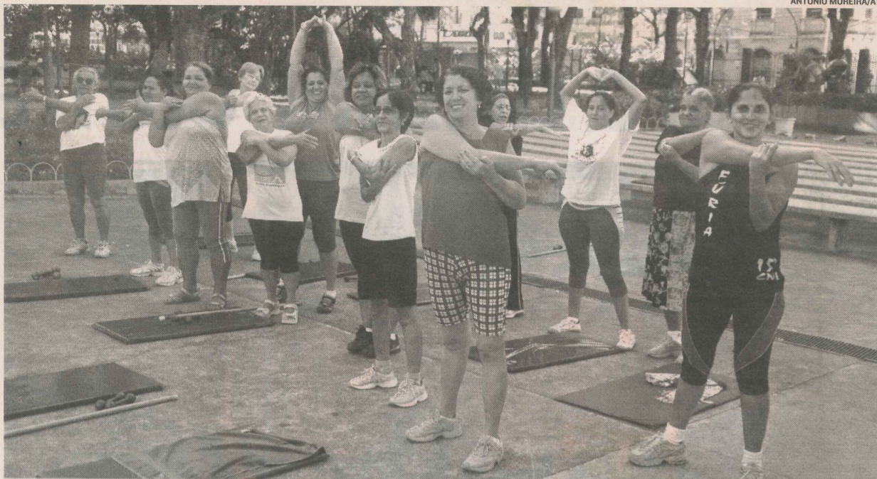
AULA DE ALONGAMENTO: mais de 100 pessoas participam diariamente das atividades físicas oferecidas no local