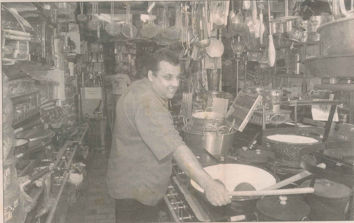
Loja especializada em venda de panelas, conchas e outros acessórios para cozinha

Há seis meses, Campos abriu a Capital Comércio de Máquina, na avenida Florentino Avidos. Também oferece 5 mil itens