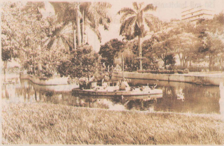
MEMÓRIA. Observando a foto da década de 70, pode-se perceber que pouca coisa mudou nos últimos 30 anos