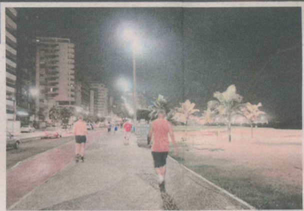
ORLAS de Camburi e de Vila Velha ontem: moradores da capital pedem iluminação e mais segurança

um novo posto da guarda municipal instalado em um quiosque da praia é relevante, mas não basta.