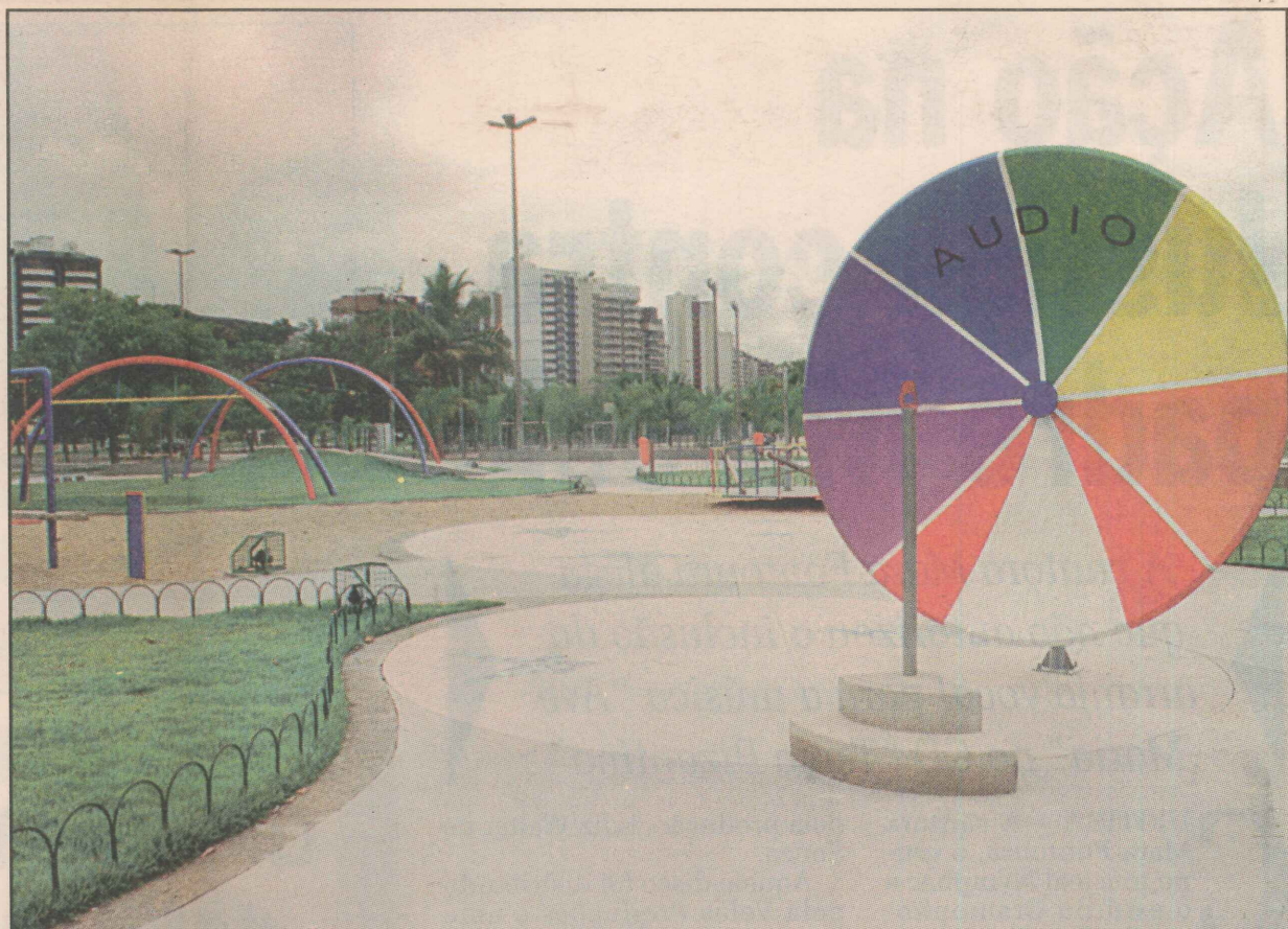
O funcionamento dos brinquedos da Praça da Ciência será explicado por funcionários da PMV

Atualmente, os moradores contam com o Artes na Praça, em funcionamento há 12 anos, e que reúne uma média de 230 expositores fixos aos sábados e domingos, das 17 às 23 horas.