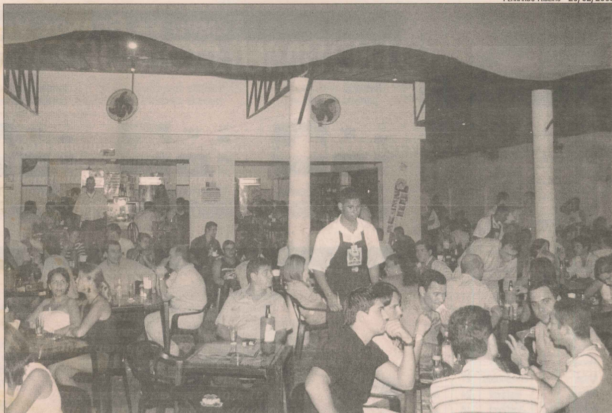
Barzinho do Triângulo das Bermudas, na Praia do Canto, com mesas lotadas

Nos bares, o cardápio também é variado, com opções de petiscos de botequins, como é o caso do Botequim Atual, até as porções mais comuns, como mariscos. A Praia do Canto é uma das poucas regiões em que o cenário muda radicalmente em poucas distâncias. Um exemplo é que enquanto na rua João da Cruz e nas vias transversais, trecho co-