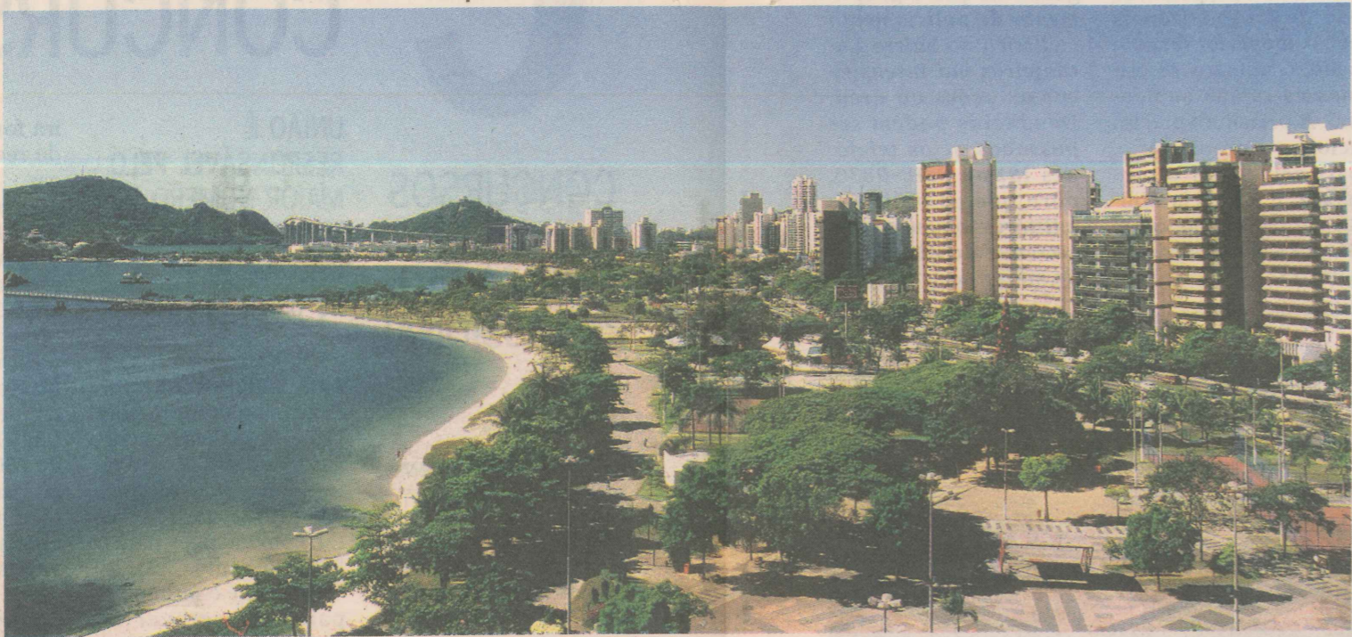
NÚMERO. A antiga Praia Comprida, que virou Praia do Canto, em 1972, abriga 12.730 moradores de classes média e alta.

çou a tomar forma de bairro residencial. Nos anos 30, os moradores já contavam com vendas, barbearias e farmácias. Foi nessa época que surgiu o primeiro clube, o Praia Tênis Clube, em 1934, e o primeiro bar popular, o Miramar. O Centenário veio depois e a