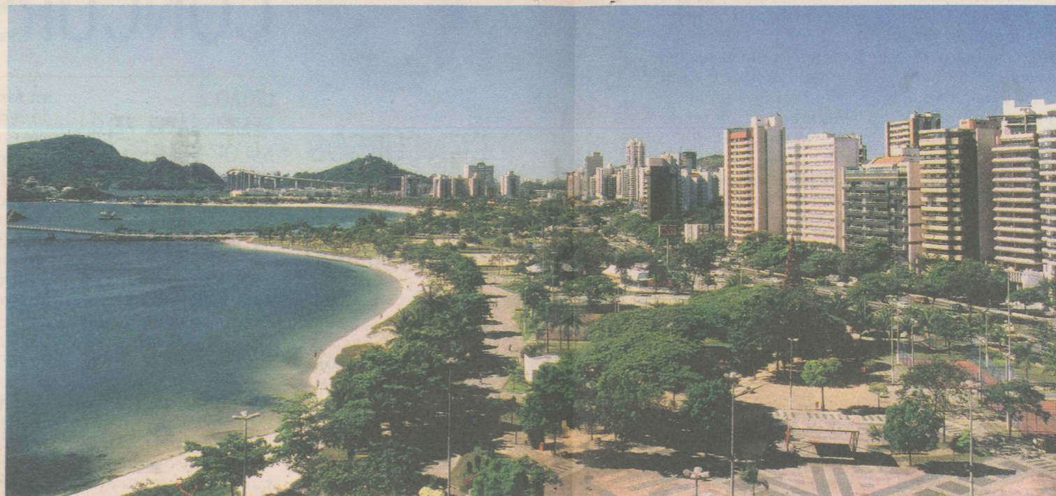
NÚMERO. A antiga Praia Comprida, que virou Praia do Canto, em 1972, abriga 12.730 moradores de classes média e alta.

çou a tomar forma de bairro residencial. Nos anos 30, os moradores já contavam com vendas, barbearias e farmácias. Foi nessa época que surgiu o primeiro clube, o Praia Tênis Clube, em 1934, e o primeiro bar popular, o Miramar. O Centenário veio depois e a