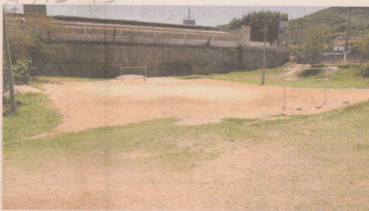
PRAÇA. Há mais de 40 anos, os moradores querem a construção de uma praça no Campo do Estrelinha.